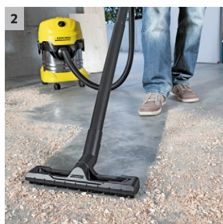
3 SING PICTURE: M:\print\WD_channel_oth_2502x502_107795.tif